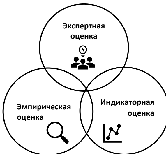
Рис.3 Классификация видов оценивания в зависимости от оснований для вынесения суждения.

Для проведения эмпирической 3 оценки – в зависимости от поставленной задачи - проводится сбор разнообразной информации о проблемной ситуации и причинах ее